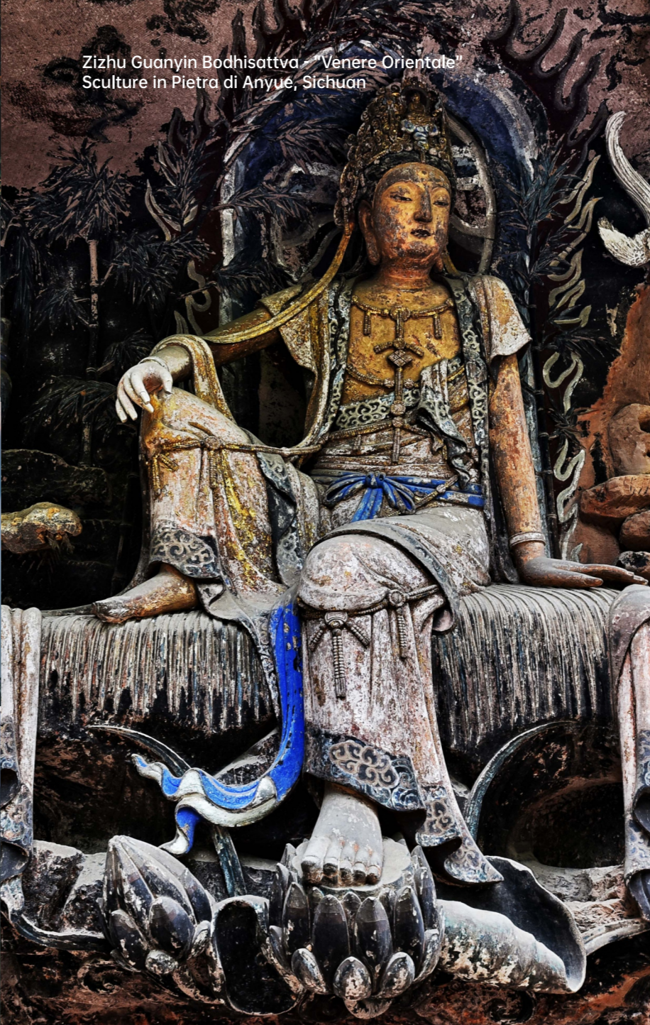
Zizhu Guanyin Bodhisattva - "Venere Orientale" Sculpture in Pietra di Anyue, Sichuan